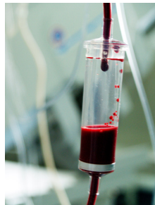
Realizace: Vzdělávací institut KZ, a.s.