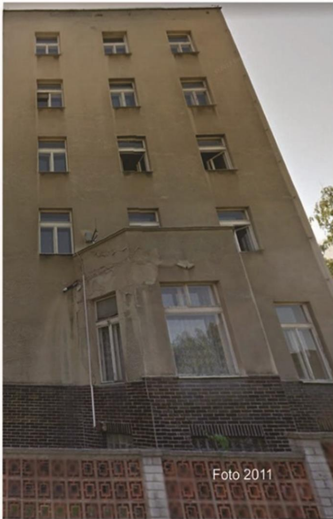
Centrum onkologické péče stav v roce 2011