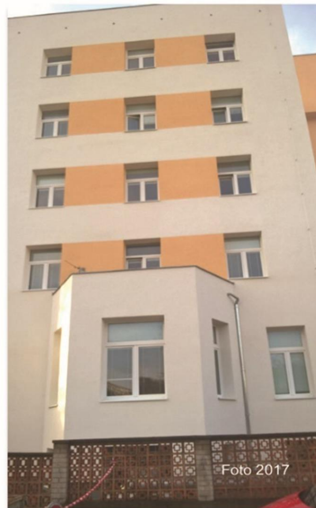
Centrum onkologické péče stav v roce 2017