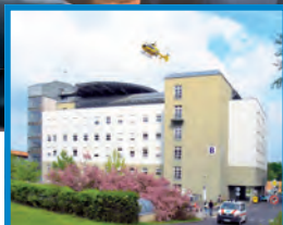
MASARYKOVA NEMOCNICE V ÚSTÍ NAD LABEM