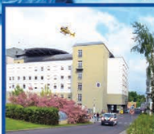
MASARYKOVA NEMOCNICE V ÚSTÍ NAD LABEM