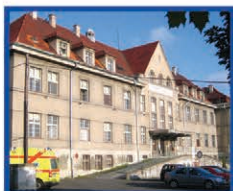
MASARYKOVA NEMOCNICE V ÚSTÍ N. L. - PRACoviŠTĚ RUMBURK

7 NEMOCNIC S NADREGIONÁLNÍ PŮSOBNOSTÍ • ODBORNÁ CENTRA VE VYBRANÝCH OBORECH A 12 KLINIK • ŠPIČKOVÉ TECHNICKÉ A PŘÍSTROJOVÉ VYBAVENÍ PRACoviŠTĚ • CENTRUM KOMPLEXNÍ ONKOLOGICKÉ PÉČE • VZDĚLÁVACÍ INSTITUT • PODPORA VĚDY A ODBORNÉHO PROFESNÍHO ROZVOJE • ŠKOLICÍ CENTRUM ROBOTICKÉ CHIRURGIE PRO STŘEDNÍ A VÝCHODNÍ EVROPU • DOPRAVNÍ ZDRAVOTNICKÁ SLUŽBA