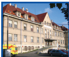
MASARYKOVA NEMOCNICE V ÚSTÍ N. L. - PRACOVISŤE RUMBURK

7 NEMOCNIC S NADREGIONÁLNÍ PŮSOBNOSTÍ • ODBORNÁ CENTRA VE VYBRANÝCH OBORECH A 12 KLINIK • ŠPIČKOVÉ TECHNICKÉ A PŘÍSTROJOVÉ VYBAVENÍ PRACOVISŤ • CENTRUM KOMPLEXNÍ ONKOLOGICKÉ PÉČE • VZDĚLÁVACÍ INSTITUT • PODPORA VĚDY A ODBORNÉHO PROFESNÍHO ROZVOJE • ŠKOLICÍ CENTRUM ROBOTICKÉ CHIRURGIE PRO STŘEDNÍ A VÝCHODNÍ EVROPU • DOPRAVNÍ ZDRAVOTNICKÁ SLUŽBA