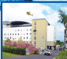
MASARYKOVA NEMOCNICE V ÚSTÍ NAD LABEM